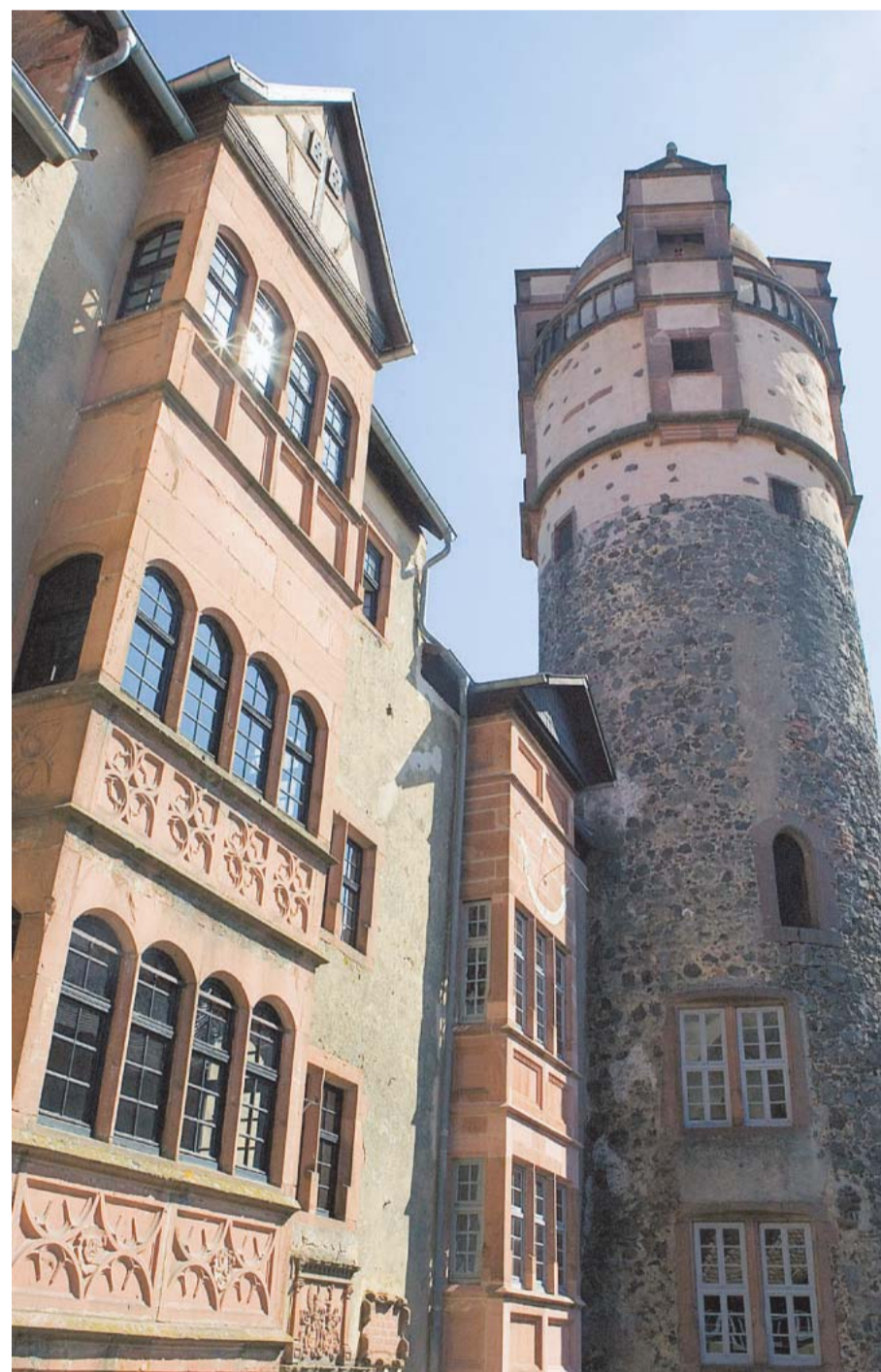
Verspricht weite Blicke: der 33 Meter hohe Bergfried im Hof der Ronneburg

Nicht umsonst sind ein großer Teil der rund 6000 Besucher pro Monat Kinder. Schon seit einigen Jahren werden auf der Burg spezielle Programme für Schulklassen und Kindergärten angeboten; öfter feiern dort Kinder ihre Geburtstage. Gemeinsam mit einer Burgführerin erkunden die Jungen und Mädchen die alten Gemäuer und spielen Ritter und Burgfräulein. Es gibt einen kleinen Kursus in Wappenkunde sowie Bogen- oder Armbrustschießen und eine Flugvorführung der Greifvögel der bergeigenen Falknerei.